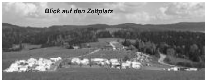
Blick auf den Zeltplatz

An Euch alle ein recht herzliches DANKESCHÖN!